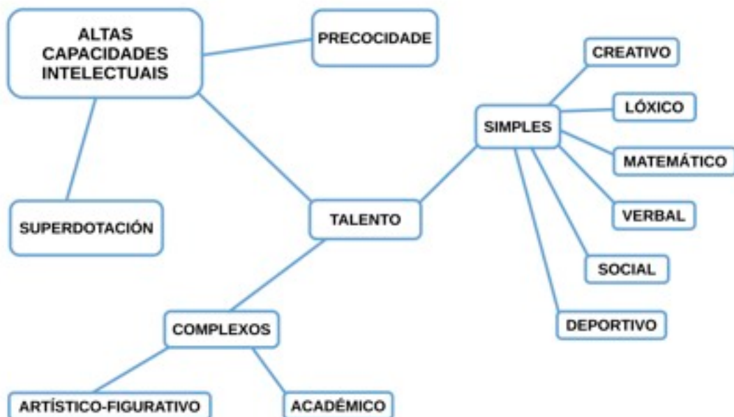
Figura I. Clasificación das altas capacidades intelectuais. Castelló e Batlle (1998)

Implica un perfil cognitivo superior e homoxéneo, cun elevado dominio en todas as áreas de coñecemento ou habilidades. No alumnado superdotado converxen un nivel intelectual elevado, unha alta creatividade e gran persistencia en determinadas tarefas.